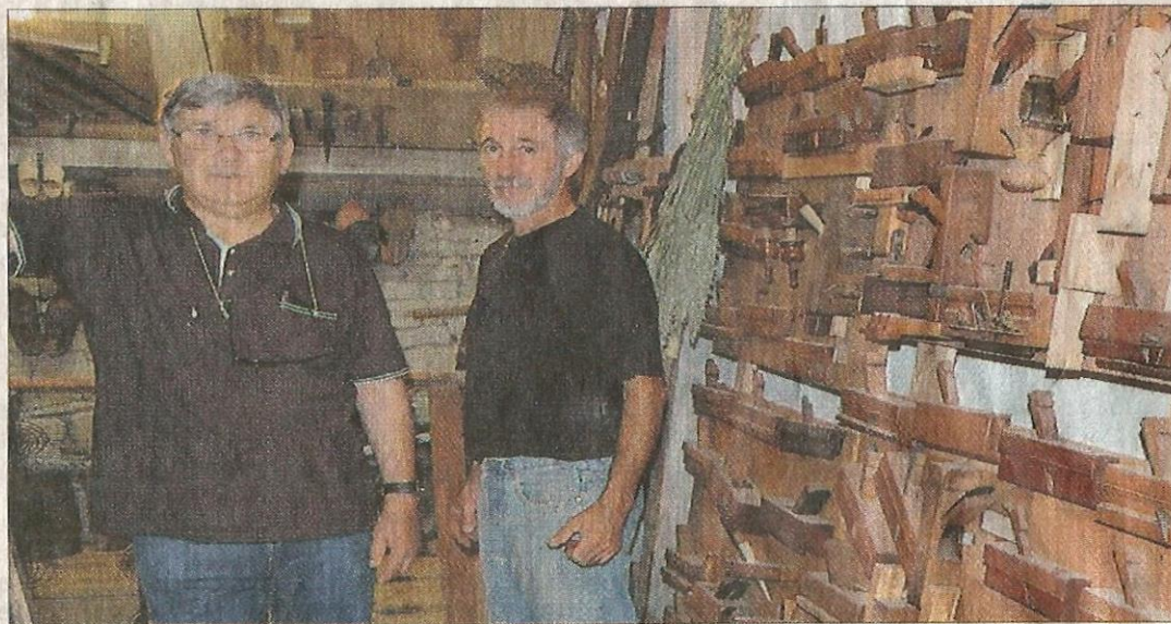
Un visiteur, ancien cheminot et menuisier admire la diversité de l'outillage.

névoles qui comptent bien pouvoir accueillir bientôt les visiteurs : touristes, écoliers et familles de la région.